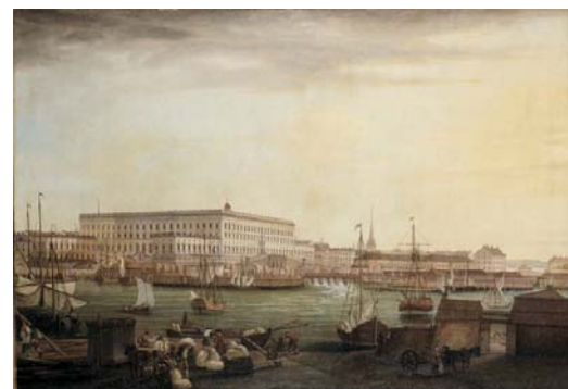
Johan Sevenbom. Från Blasieholmskajen mot slottet och Helgeandsholmen, 1776

Hur tyder jag då ”expressional mening” i målningarna? Får jag samma känsla av båda målningarna? Nej, jag tycker att den övre ser mer varm och välpolerad ut. Den undre med sin blåa ton känns svalare och den mer oskarpa konturer känns mer avspänd och naturlig.